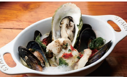
宮城県産アンコウと鳴瀬のどろ牡蠣の アクアパッツァ 2,484円 夜