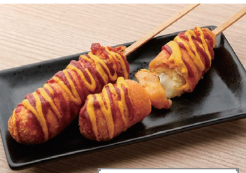
ホヤットグ 1本 540円 夜