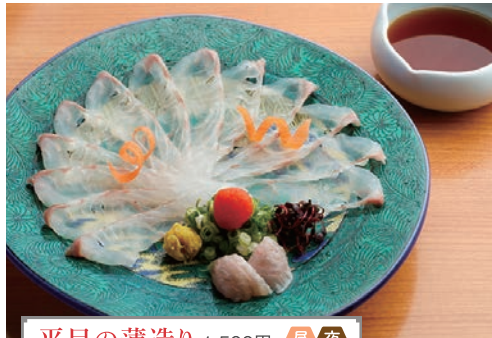
平目の薄造り 1,500円 昼 夜