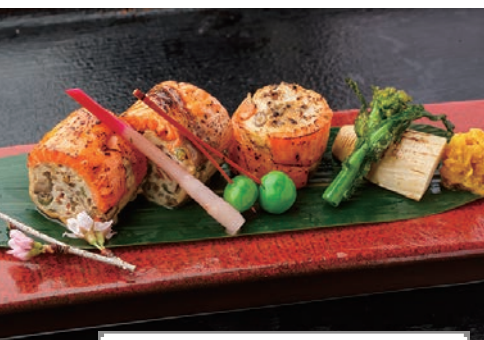
桜鱈のけんちん焼き 950円 夜

宮城県仙台市青葉区国分町2-8-9 ☎022-714-1550 営業時間 11:30〜15:00(ラストオーダー14:00)、18:00〜24:00 (ラストオーダー23:30) 休日曜(日曜)を含む連休の場合は 連休最終日、第3月曜 日なし 個室26席 個室2,000円、夜7,000円 ☑可 ☑可 ※2F個室は要予約 営業時間 21:00以降のみ喫煙可 宮城県仙台市青葉区国分町2-8-9 ☎http://bistro-encore.com/