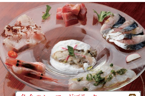
魚介のシーフードプラッター 1,940円 夜

仙台市泉区南光台東1-53-22 ☎022-252-5030 ■11:00～21:00(ラストオーダー20:30) ※木曜(祝日の場合は営業、翌日休み) ■14台 席100席 昼2,500円、夜4,000円 可 預可 喫全席禁煙 ☒地下鉄旭ヶ丘駅より車で6分 HP:https://www.unagi-chikutei.jp/