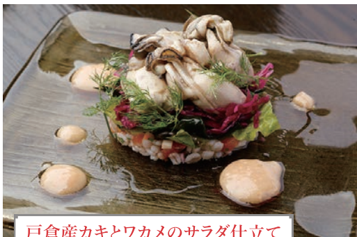
戸倉産カキとワカメのサラダ仕立て 1,296円 昼 夜 ※昼は要予約