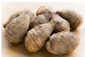
上伊場野里芋イメージ